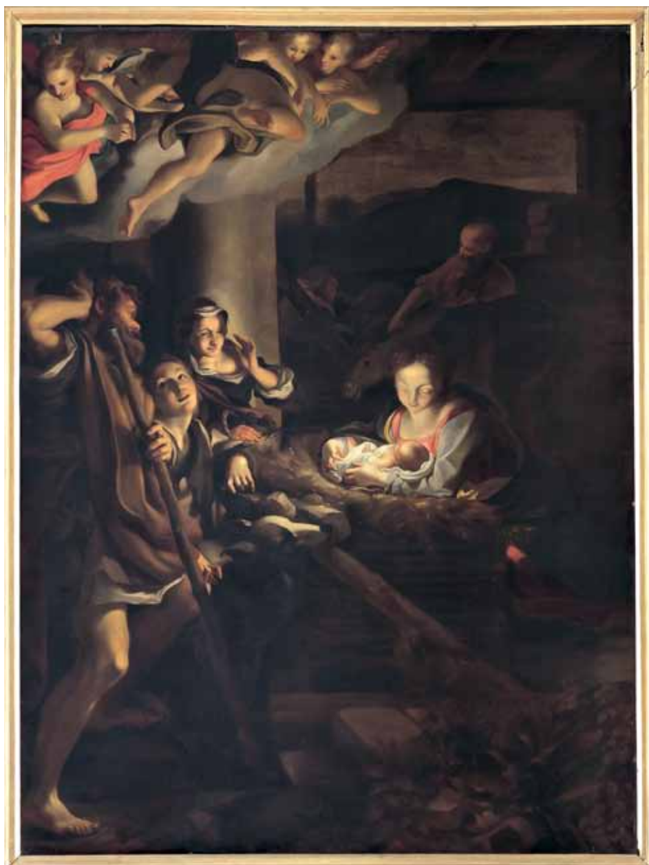
Adorazione dei pastori detta "la Notte" - Antonio Allegri detto il Correggio, 1525 Commissionato per la Basilica di San Prospero, Reggio Emilia L'originale è conservato c/o la galleria Gemäldegalerie di Dresda

Voglio, innanzi tutto, ricordare i Colleghi che ci hanno lasciato, con il loro carico di ricordi e esperienze. Tutti siamo stati toccati, direttamente o indirettamente dal disastroso sisma della scorsa primavera, che ha messo in ginocchio l'intera economia della bassa reggiana. Ma dopo i primi momenti, di lutti e sconforto, tutti si sono rimboccati le maniche e, seppur senza gli aiuti pubblici che tardano a giungere, oggi è tutto un fiorire di cantieri e iniziative. E anche i Periti Industriali hanno fatto la loro parte, Come Collegio e come Federazione Regionale, abbiamo voluto dare il nostro contributo di solidarietà, contattando molti iscritti delle zone colpite. Abbiamo poi aderito alla sottoscrizione aperta in loro favore e gestendo, quali responsabili della Federazione Regionale, il fondo di solidarietà aperto allo scopo. Nel prossimo mese di gennaio si provvederà all'assegnazione dei fondi raccolti che, a oggi, hanno superato la cifra di centomila euro. L'attività in favore delle zone colpite non si è limitata a questo. Ci si è coordinati a livello regionale per